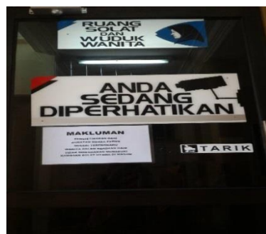
Ruang wuduk dan solat yang seambung