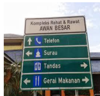
Petunjuk arah yang memudahkan pengunjung