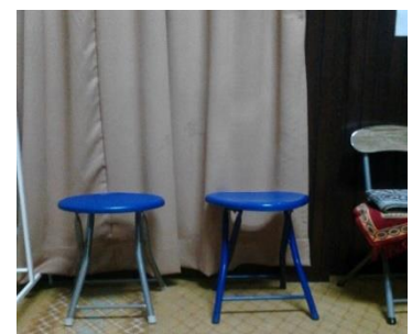
Kerusi disusun rapi