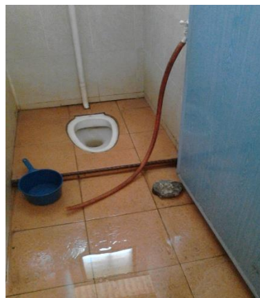
Batu sebagai kunci pintu tandas