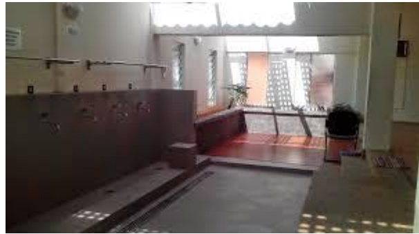
Pencahayaan yang baik diruang wuduk dan solat

Gambar foto (kiri atas sekali) menunjukkan ruang wuduk yang terbuka di salah satu masjid yang sering dikunjungi. Ketidaktepatan pihak AJK dan pengurusan masjid menyebabkan masalah pendedahan kepada aurat wanita. Umum mengetahui bahawa keseluruhan tubuh kecuali muka dan tapak tangan merupakan aurat yang perlu dijaga oleh wanita. Masjid merupakan rumah Allah. Justeru, selain dari rumah sendiri seharusnya wanita mudah untuk menjaga auratnya di rumah Allah. Ruang wuduk yang terbuka untuk wanita Islam adalah tidak mesra wanita Islam. Ruang wuduk dan ruang solat yang sebumbung memberikan keselesaan kepada para pengguna wanita Islam. Terdapat usaha beberapa buah masjid yang prihatin tentang aurat wanita Islam dan meletakkan pengadang supaya boleh melindungi pergerakan wanita Islam keluar masuk dari ruang wuduk ke ruang solat. Selain dari itu, pencahayaan dan pengudaraan yang baik diruang wuduk dan solat boleh mengelakkan ruang tersebut dari berbau hapak atau berkulat.