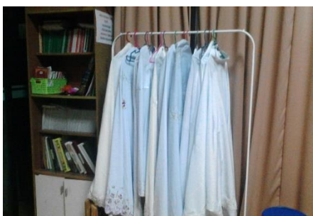
Telekung yang disusun rapi