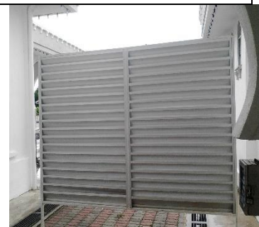
Penghadang diletakkan antara ruang tandas dan wuduk