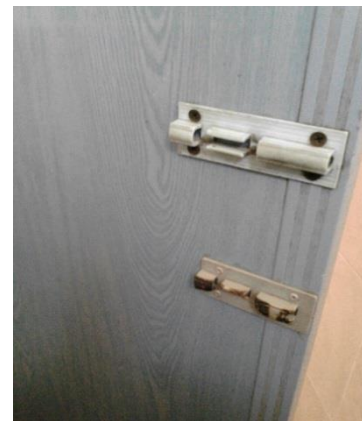
Tiada ensel tandas

Pengurusan masjid atau AJK masjid boleh juga meletakkan beberapa papan tanda peringatan kepada pengunjung wanita Islam yang menggunakan kemudahan masjid supaya lebih beretika semasa menggunakan prasarana tersebut. Gambar-gambar dibawah adalah contoh peringatan mesra yang boleh digunakan oleh pengurusan masjid dan surau kepada pengguna prasarana masjid.