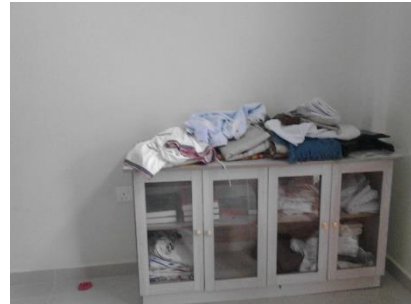
Telekung yang bersepah