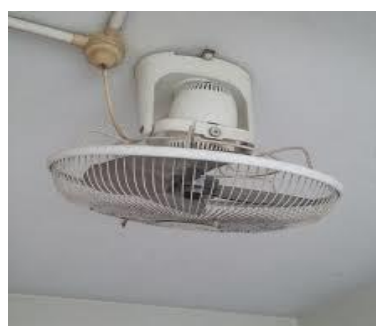
Kipas yang dijaga dengan