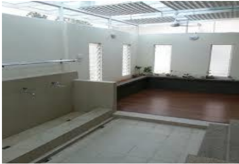
Ruang wuduk dan solat yang sebumbung