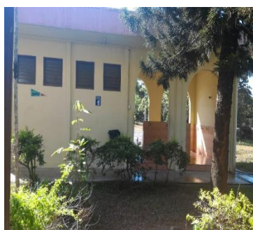
Ruang wuduk wanita Islam yang terbuka