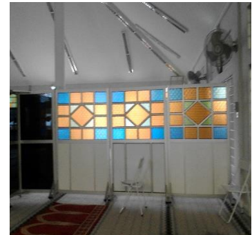
Contoh contoh tirai yang memisahkan ruang solat wanita dari ruang solat lelaki