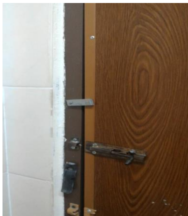
Kunci dan ensel tandas yang rosak

Disarankan jarak tandas dari masjid diletakkan berhampiran dan menjadi kawasan eksklusif kaum wanita Islam sahaja. Ini untuk mengelakkan dari terlihatnya aurat kaum wanita Islam semasa di dalam perjalanan dari tandas ke tempat wuduk dan seterusnya ke ruang solat. Ia juga memudahkan pengunjung wanita yang berusia dan bagi mereka yang membawa anak-anak kecil. Ruang tandas yang bersambung atau dibina sebumbung dengan kedua-dua ruang wuduk dan ruang solat memudahkan wanita menjaga aurat mereka. Pintu tandas yang mempunyai selak yang berfungsi sangat diperlukan oleh wanita Islam ketika menggunakan tandas. Ini kerana ia memberi keselesaan kepada wanita Islam yang sering menjadi pengguna bilik air dan tandas masjid untuk keperluan naluri semulajadi mereka. Terdapat pintu tandas yang tidak dikawal selia dan mengalami kerosakan dimana tidak boleh dikunci dari dalam.