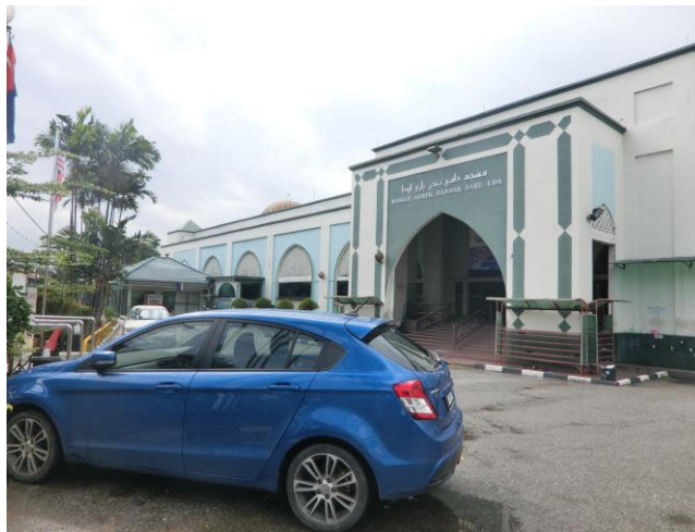
Masjid Jamek Bandar Baru Uda

Antara cadangan yang boleh dipetik dari sorotan literatur mengenai institusi masjid adalah masjid perlu diurus sepenuh masa secara profesional. Kebanyakan masjid yang besar dalam herarki seperti masjid negara dan masjid negeri mempunyai staf sepenuh masa bagi pengurusan masjid. Terdapat juga beberapa masjid di herarki masjid jamek yang mempunyai pengurusan profesional melebihi piawaian seperti Masjid Jamek Bandar Baru Uda, Johor Bahru . Masjid ini merupakan masjid qariah yang mempunyai staf yang dibiayai oleh yaysan masjid.