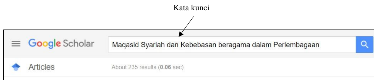
Rajah 2: Contoh carian yang digunakan dalam pautan Google Scholar

Berdasarkan Rajah 1, pengkaji menggunakan kata kunci “ maqasid syariah ” dalam ruang carian dan ditapis secara spesifik untuk mendapatkan hasil carian dalam jenis artikel sahaja. Hasil carian juga dihadkan kepada artikel yang relevan dan berkaitan sahaja. Terdapat 92 hasil carian daripada Myjurnal.