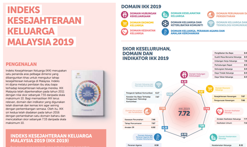
Rajah 1: Infografik Domain IKK 2019