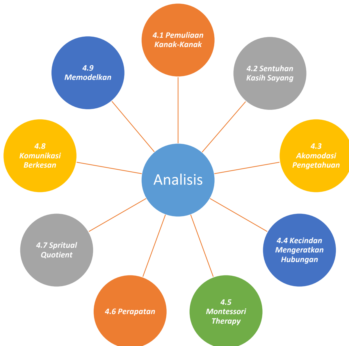
Rajah 2 : Analisis Hadith Ya Aba Umayr terhadap interkasi sosial kanak-kanak