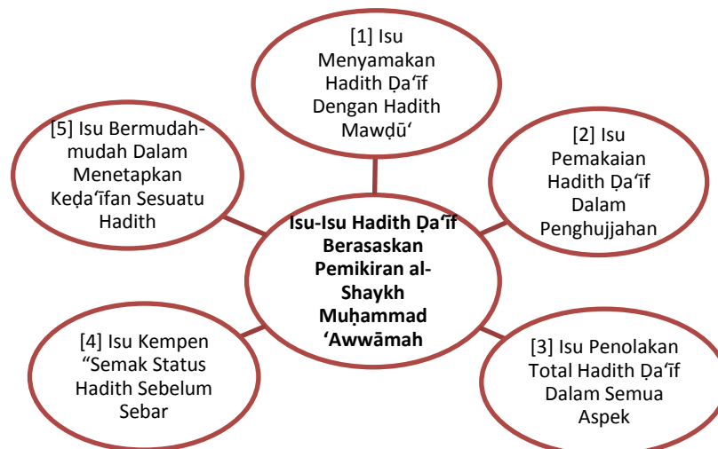
Rajah 2.0: Isu-Isu Hadith Ḍa'if Berasaskan Pemikiran al-Shaykh Muḥammad 'Awwāmah

Isu bermudah-mudah dalam menetapkan keḍa'ifan sesuatu hadith ini perlu diberi perhatian yang jitu kerana ditakuti terlibat dalam melakukan penipuan terhadap kalam baginda Nabi SAW.