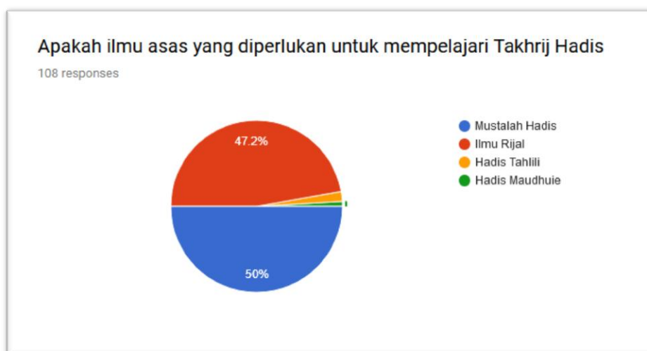
Carta 1: Asas Ilmu Takhrij