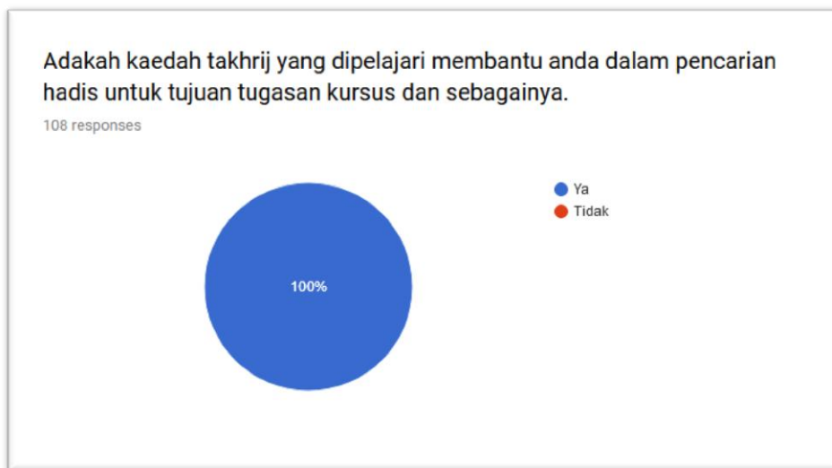
Carta 2: Faedah Ilmu Takhrij

100% Respondan mengakui bahawa ilmu takhrij yang dipelajari mereka sangat bermanfaat dalam membantu mereka menghasilkan kajian yang berkaitan kursus dan tujuan-tujuan lain.