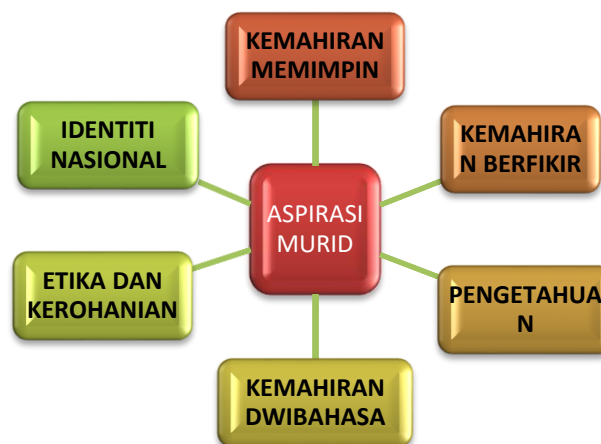
Rajah 3: Enam Aspirasi Murid.

Selain keberhasilan aspirasi sistem pendidikan, PPPM 2013 – 2025 telah membina enam ciri utama aspirasi murid yang dikatakan amat perlu dalam pendidikan berprestasi tinggi bagi membolehkan menerajui pembangunan ekonomi dan dunia global masa hadapan. Enam ciri-ciri utama tersebut ialah pengetahuan, kemahiran berfikir, kemahiran memimpin, kemahiran dwibahasa, etika dan kerohanian, dan identiti nasional (Lihat Rajah 3).