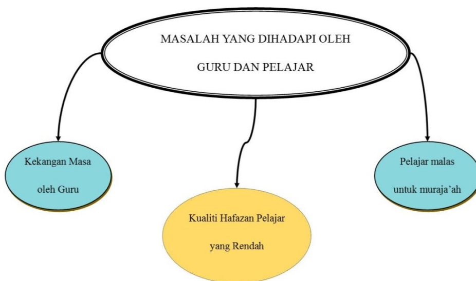
Rajah 2 Masalah yang Dihadapi oleh Guru dan Pelajar

Keenam-enam kaedah muraja’ah tersebut dilakukan mengikut jadual harian di sekolah atau madrasah tahfiz masing-masing. Walaubagaimanapun, terdapat juga kekangan dan masalah yang telah dihadapi oleh guru-guru dalam mengendalikan kelas hafazan dan muraja’ah dalam kalangan pelajar di sekolah mereka. Rajah 2 berikut menjelaskan permasalahan yang telah dihadapi oleh guru al-quran semasa proses kelas hafazan dan muraja’ah al-quran pelajar mereka.