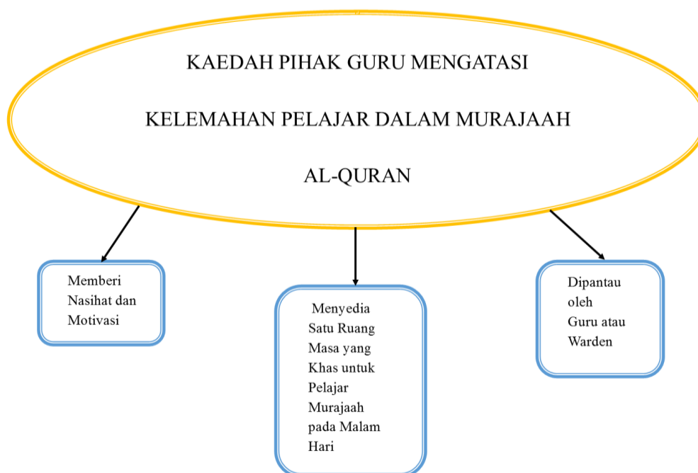
Rajah 3 Kaedah yang Dilakukan Guru Bagi Mengatasi Masalah Kelemahan Pelajar dalam Muraja'ah Al-Quran (Sumber: Soal Selidik 2018)

Berdasarkan rajah 3 di atas para guru dilihat mempunyai jiwa pendidik yang baik dan menjadi pembimbing paling berpengaruh untuk menjaga kualiti hafazan pelajar. Mereka tidak jemu memberi nasihat dan motivasi serta meluangkan masa untuk pelajar supaya para pelajar dapat muraja'ah dan mengingati ayat-ayat suci al-Quran. Mereka juga menyediakan masa khas pengulangan al-Quran kepada pelajar iaitu pada waktu petang dari 3.30 - 4.30 dan waktu malam selepas solat isyak sehingga 10.30 malam. Proses muraja'ah ini dilakukan dan dipantau secara berjadual oleh guru al-Quran atau warden asrama. Hal ini berdasarkan hasil analisa daripada pihak informan sebagai berikut: