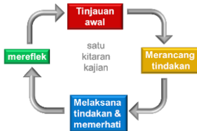
Model Kajian Tindakan Kemmis & McTaggart

Sampel kajian adalah pelajar kursus bahasa Arab di Fakulti Sains Sosial Universiti Islam Selangor yang dipilih secara purposif seramai 10 orang daripada kelas kursus NDWU1072, bahasa Arab untuk pelajar diploma semester 2 pengajian Islam. Kajian kualitatif ini menggunakan teknik analisis dokumen dan pemerhatian untuk proses dapatan dan analisis data.