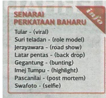
Jadual 2: Bahasa Moden & Slanga : Kata lazim yang sepadan