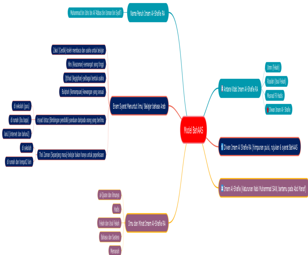
Rajah 1. Model BahAAS dalam aplikasi ED Edraw Mind Master