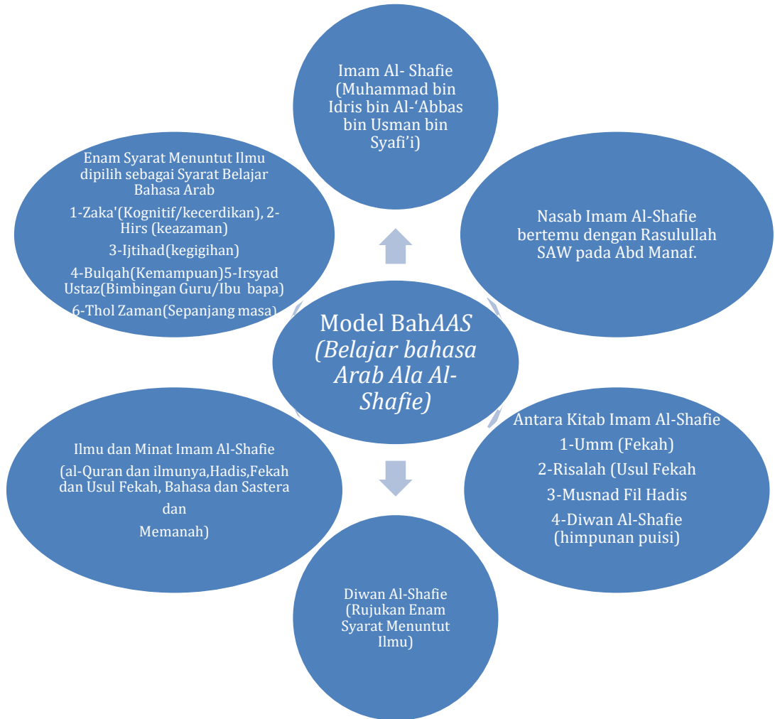
Rajah 2. Model BahAAS dalam aplikasi MS Word Smart Art