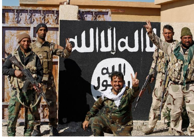
Rajah 4: Anggota penganas ISIS yang bertopengkan agama Islam.

Namun, prinsip jihad ISIS telah jauh terpesong sama sekali apabila jihad yang ditonjolkan adalah membunuh sesiapa sahaja yang tidak menyokong perjuangan mereka, membunuh golongan yang tidak sama ideologi dengan mereka, membunuh tentera-tentera Iraq, dan orang-orang awam yang tidak bersalah (Haron, 2014). Keadaan ini sangat berbeza dengan konsep jihad yang dianjurkan oleh agama Islam.