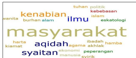
Rajah 2. Elemen dalam tafsir mawdu'i

Seperti yang dijelaskan, para pentafsir mawdu'i perlu menjelaskan secara terang tema-tema yang terkandung di dalam al-Quran, maka apabila mentafsirkan surah, topik atau lafaz secara mawdu'i mereka akan menentukan terlebih dahulu tema yang bersesuaian (Al-Khalidi, 2012; Muslim, 2000). Diantara tema-tema yang dijadikan sebagai kajian dalam tafsir mawdu'i ialah aqidah, kiamat, syirik, ekonomi, syaitan, akhlak, ilmu dan masyarakat (Sahlawati, Haziyah, & Wan Nasyruddin, 2019). Rajah 2 di bawah menunjukkan elemen-elemen yang terdapat dalam tafsir mawdu'i yang didominasi oleh tema masyarakat, kenabian dan aqidah.