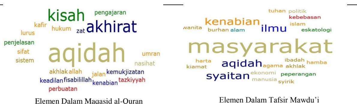
Rajah 3. Elemen Dalam Maqasid al-Quran dan Elemen Dalam Tafsir Mawdu'i

Rajah 3 di bawah adalah gabungan elemen dalam maqasid al-Quran dan elemen dalam tafsir mawdu'i. Jika diteliti maqasid al-Quran lebih menekankan aspek aqidah manakala tafsir mawdu'i lebih memberi tumpuan kepada aspek masyarakat. Akan tetapi aspek aqidah tetap menjadi tema perbahasan tafsir mawdu'i dan beberapa elemen lain seperti hari akhirat, kenabian dan akhlak.